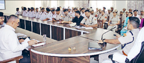
फतेहाबाद। ट्रेफिक पुलिस कर्मचारियों की बैठक में निर्देश देते एसपी सिद्धांत जैन।

जिले में यातायात व्यवस्था को और अधिक सुचारु एवं सुरक्षित बनाने के उद्देश्य से पुलिस अधीक्षक सिद्धांत जैन की अध्यक्षता पुलिस लाइन स्थित एनजीओ मेस के सभागार में समीक्षा बैठक आयोजित की गई। बैठक में जिलेभर से यातायात पुलिस अधिकारी एवं कर्मचारी उपस्थित रहे। इस दौरान ट्रेफिक व्यवस्था की