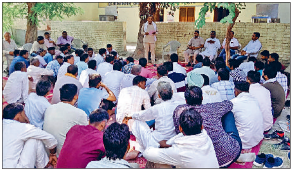
फतेहाबाद। कर्मचारियों को संबोधित करते सर्व कर्मचारी संघ के नेता।