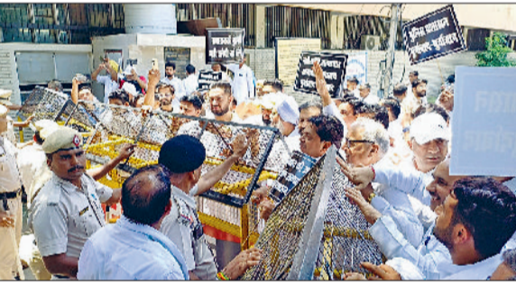
सिरसा। कांग्रेस एसपी ऑफिस पर पुलिस के खिलाफ प्रदर्शन करते।

पुलिस द्वारा काटे जा रहे चालान के विरोध में मंगलवार को कांग्रेस कार्यकर्ताओं ने पुलिस अधीक्षक कार्यालय पर रोष प्रदर्शन किया। इस दौरान कांग्रेस कार्यकर्ताओं और पुलिस के बीच धक्का-मुक्की भी हुई। एसपी ऑफिस की आर जा रहे कार्यकर्ताओं को पुलिस ने बेरिकेट्स लगाकर रोकने का प्रयास किया। कार्यकर्ताओं ने पुलिस प्रशासन के खिलाफ नारेबाजी की और भेदभाव पूर्ण काटे जा रहे चालान पर रोष का इजहार किया। प्रदर्शनकारियों से ज्ञापन लेने के लिए कोई नहीं आया,