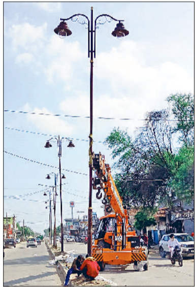
रतिया। स्ट्रीट लाइट लगाते हुए ठेकेदार के कर्मचारी।

194 प्राथमिक स्कूलों को बंद करने की तैयारी है। 4201 स्कूलों का विलय कर दिया गया है। बीईओ/डीईओ दफ्तरों को ही खत्म करने की तैयारी है। सीधे क्लस्टर डीईओ से जुड़ेंगे।