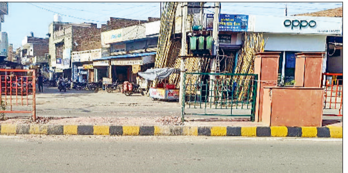
फतेहाबाद। पिलर तोड़ने के बाद खुला रास्ता।

सचदेवा ने कहा कि वर्तमान स्थिति के चलते हर समय यहां दुर्घटना का भय बनारहता है। डिवाइडर पर पुरानी ग्रील को ही दोबारा लगा दिया गया है। 10 साल पहले जब यह ग्रील लगाई गई थी, उस समय भी इसकी विजिबिलिटी को लेकर बहुत प्रश्न खड़े हुए थे। हर कट पर विजिबिलिटी कम होने के कारण दुर्घटनाएं होती रहती थीं। उन्होंने डीएमसी से मांग की है कि शमशान भूमि के सामने एक बड़ा कट छुड़वाया जाए जिससे शमशान भूमि के शव वाहन, एम्बुलेंस वाहन आसानी से गुजर सकें और लोगों का आवागमन भी आसान रहे। इसके अलावा सड़क के दोनों तरफ स्पीड ब्रेकर भी बनाए जाएं।